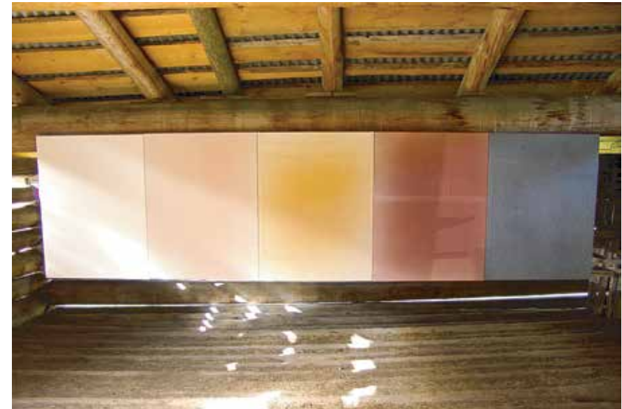
«Seelenbild» in der Heinzenkapelle, St. Antönien. Die Farben von links nach rechts: Schijenweiss, Schijenrosa, Domgelb, Klostersrot, Prättigrau. Die Maltücher sind Fadenarbeiten aus dem Prättigau.

Farben aus der Tube. Sie schaffen Beziehungen, sie berühren emotional – den richtigen Begriff für ihre Wirkung habe ich noch nicht gefunden. Mich interessiert auch: was ist das schwärzeste Schwarz? Das leuchtendste Weiss? Weil mich wunder nimmt, was dahinter steckt und womit ich arbeite, habe ich mich an die SGK gewendet.