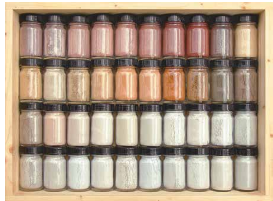
Ein Teil der pulverisierten Alpen: Von Flixrot bis Bettazzagraniticeviottutti.

Vielfalt und die Nuancen, die finde ich faszinierend. Ich probiere auch aus, was sich mit den Pigmenten alles machen lässt: Schminke, Textilien färben, Wandanstriche, oder auch: Wie schmecken sie? Bei der Arbeit mit den Pigmenten und in der AlpWerkstatt, wo ich zum Beispiel mit Kindern und Erwachsenen Steinpigmente herstelle, merke ich: Diese Gesteinsfarben sind mehr als synthetische